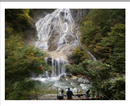
写真3 蛇谷園地（姥ヶ滝）