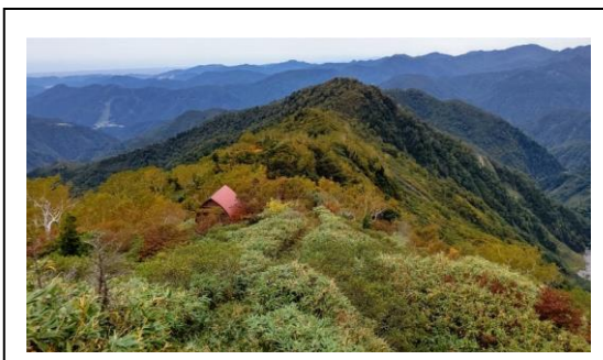
写真2 奥長倉避難小屋